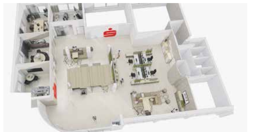
Die Hagenbacher Filiale mit der neuen Digitalisierunginsel.