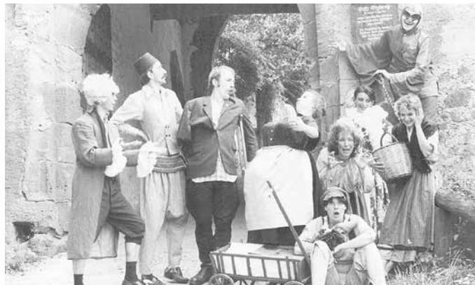
Wie alles begann: Das Chawwerusch-Ensemble aus dem Gründungsjahr 1984.

Bereich Theaterpädagogik und interessierten sich bei ihren Stücken schon immer für die Geschichten hinter der Geschichte und damit verbundene menschliche Schicksale. Neben dem Schauspiel war für das Chawwerusch Theater Theaterpädagogik immer ein wesentliches Standbein. Die Idee, über die Kinder- und Jugendtheater-Tage die vielfältige (Schul)Theaterszene im Kreis professionell zu unterstützen, stieß beim Kreis SÜW gleich auf offene Ohren und wurde seit 1992 intensiviert. Waren es anfangs noch eine allgemeine Beratung mit Hilfestellungen für die Aufführungen oder organisatorische Tipps, liegt heute der Schwerpunkt bei der individuellen Beratung von bestehenden Ensembles und Unterstützung von Gruppen, die sich neu formieren wollen. Fragen von „Welches Stück könnten wir spielen?“ bis zu „Welche Aufwärmspiele gibt es?“ werden maßgeschneidert für die Spielgruppe beantwortet.