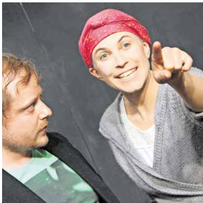
„10 things before I die“ war das erste Expeditionsstück 2014.

Weitere Informationen unter www.chawwerusch.de