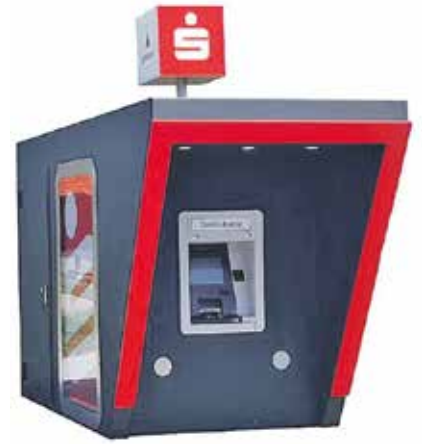
Wichtig für die flächendeckende Versorgung: die Pavillons der Sparkasse Südpfalz.

Sicherheit hat für uns oberste Priorität. Wir evaluieren intensiv, in welchen Filialen die Geldautomaten aufgrund einer hohen Gefährdungslage nach draußen verla-