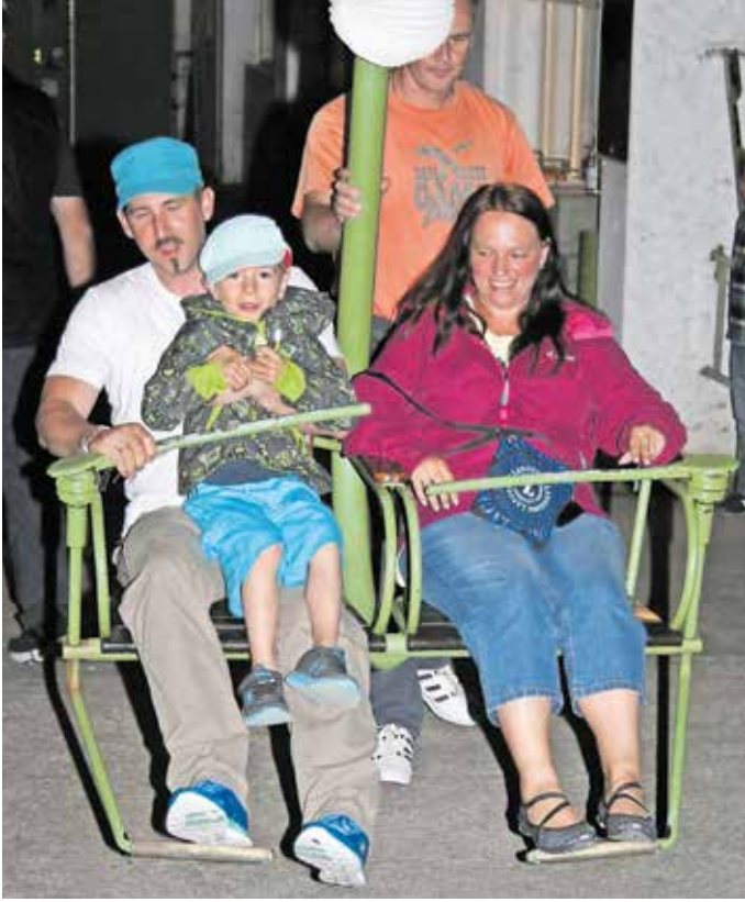
Sehr beliebt sind die alljährlichen Lampionfahrten mit der Rietburgbahn.