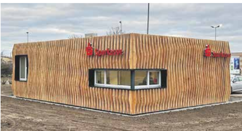
Nachhaltigkeit spielt auch bei Neu- und Umbauten eine Rolle, wie hier in der Filiale in Maikammer.

Einer der wesentlichen Erfolgsfaktoren unseres Geschäfts ist unsere Kundennähe. Um diese weiterhin zu gewährleisten, passen wir die Gestaltung unserer Filialen immer an die Bedürfnisse unserer Kundinnen und Kunden an, wandeln uns nachhaltig und werden digitaler. Unsere Investition ist vor allem eine Investition in die Nähe zu unseren Kunden. Die Modernisierung unserer Geschäftsstellen ermöglicht es uns, den Kunden ein qualitativ hochwertiges Umfeld und erstklassige Beratung zu bieten. So bleiben wir nah an den Bedürfnissen der Menschen in unserer schönen Südpfalz.