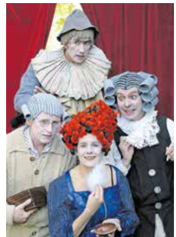
Irgendwie komisch wird es immer beim Chawwerusch Theater, nicht nur bei der Aufführung der „Komödiantin“ im Jahre 2004.