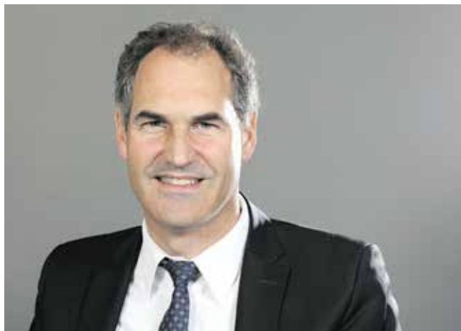
Landrat Dietmar Seefeldt

Gestaltung: Digitale PrePress GmbH, Amtsstr. 5-11, 67059 Ludwigshafen