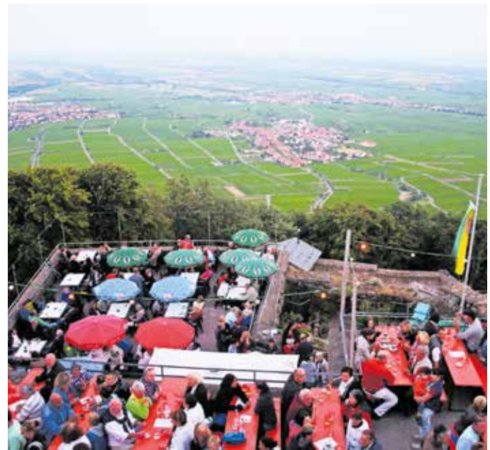
Eine herrliche Aussicht bietet sich oben von der Rietburg.

Weitere Infos unter www.rietburgbahn-edenkoben.de