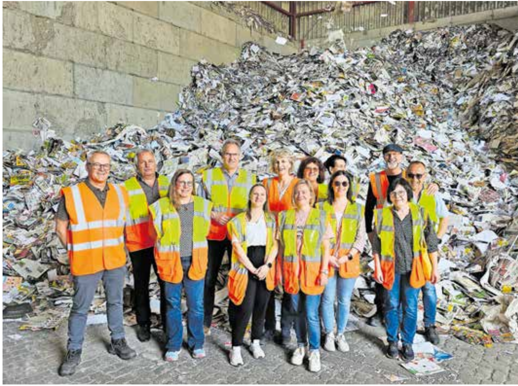
Im Hintergrund rieselt das sortierte Papier beim Besuch in Schifferstadt.

Jede Art von Papier, seien es Druckerzeugnisse wie das SÜW-Journal, Kataloge, Verpackungen aus Papier, Pappe oder Kartonage, wird bei uns im Landkreis über die schwarze Papiertonne eingesammelt.